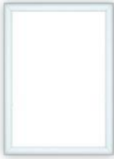
Rysunek 2 Ramka OWZ na plakaty B2