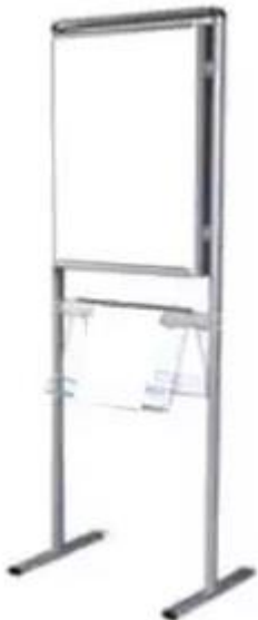
Rysunek 3 Stojak dwustronny na plakaty B2 z kieszeniami A4

Każdy stojak reklamowy musi mieć minimum 24 miesiące gwarancji