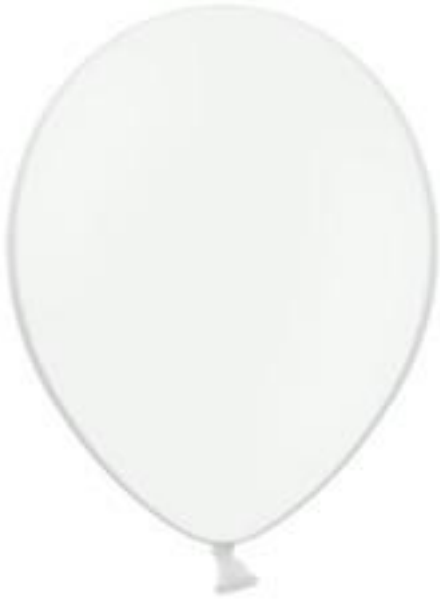
Rysunek 6 Balon reklamowy 12" w przykładowym kolorze

Wykonawca zobowiązuje się do dostarczenia balonów w ilości i kolorze określonym przez Zamawiającego. Termin realizacji/dostarczenia balonów: ostatni tydzień września 2016 r.