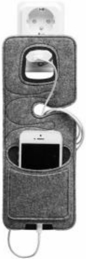
Rysunek 7 Uchwyt na telefon z logo

Wykonawca zobowiązuje się do dostarczenia uchwytów na telefon z logo BCTW w terminie najpóźniej do końca sierpnia 2016r.