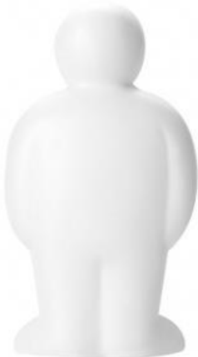
Rysunek 8 Zabawka antystresowa ludzik z logo

Znakowanie: tampodruk, w pełnym kolorze. Pianka PU. Waga: 22 gramy. Dopuszczalne odchylenie od wagi: +/- 5 gramów.