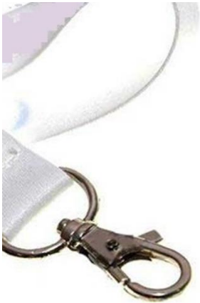
Rysunek 5 Smycz zakończona karabinkiem

Gadżety należy dostarczyć do Zamawiającego w specjalnym, szczelnie zabezpieczonym, przeznaczonym do przechowywania opakowaniu np. kartonie.